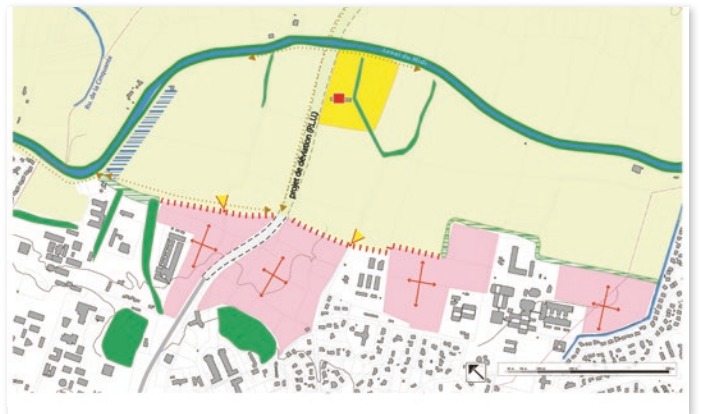
Extrait du plan directeur des abords du canal du Midi du Sicoval (Etat et SICOVAL - Elaboré avec l'appui technique de l'Agence Paysages).