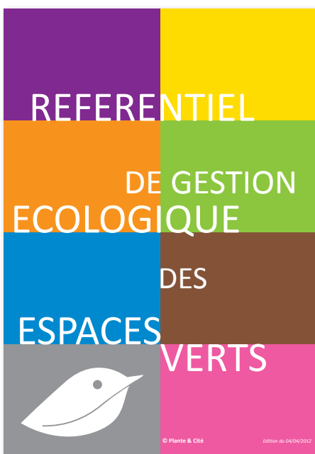
Le référentiel Ecojardin. © Plante & Cité

http://www.plante-et-cite.fr/data/pdf_fiches/synthese/2014_10_15_guide_conception_ecologique_BR.pdf